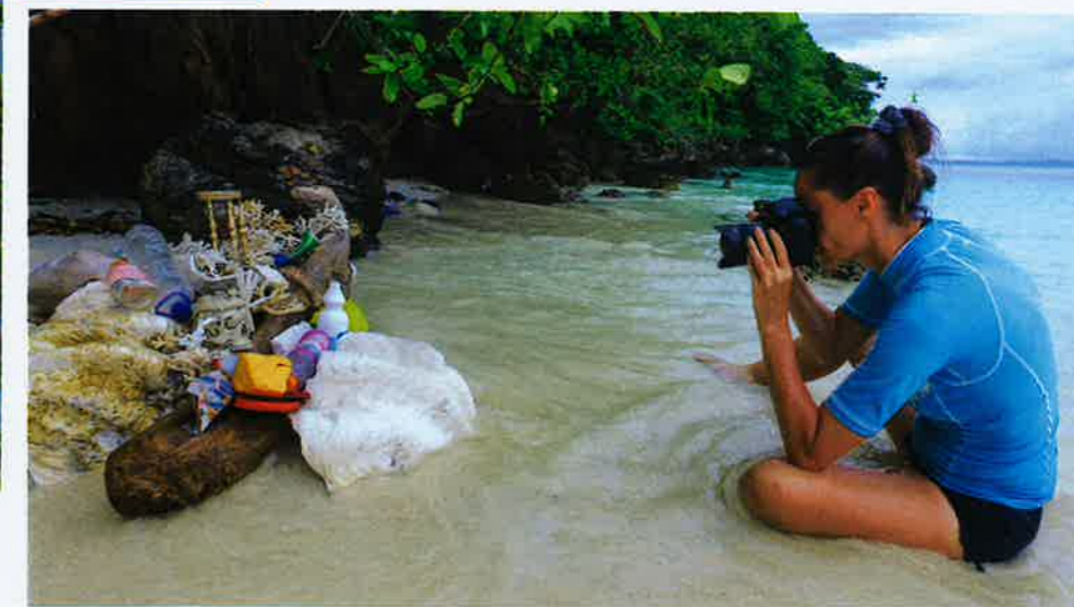
un'installazione artistica con rifiuti di plastica.